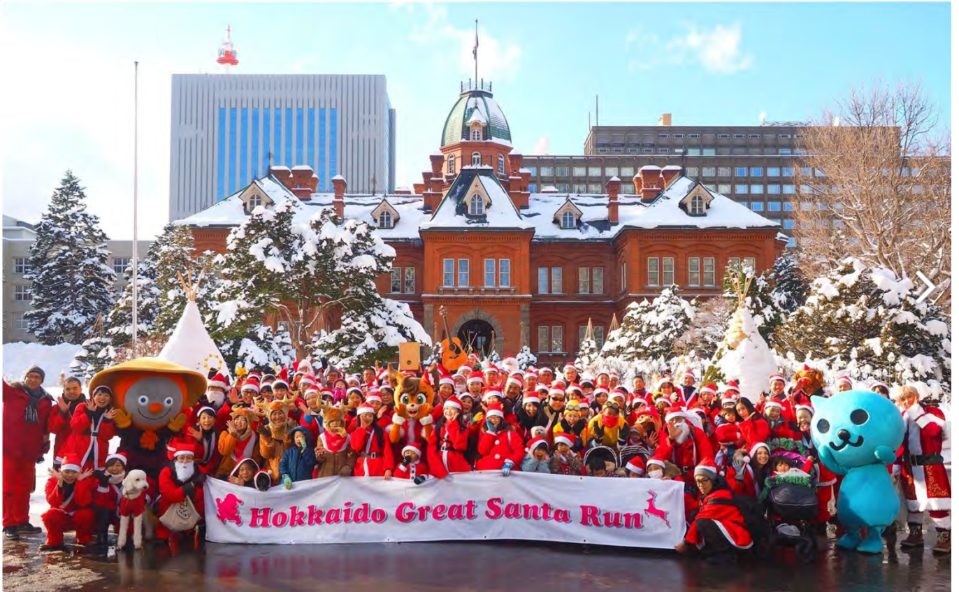
2017年札幌サンタファンの様子